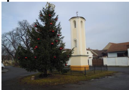
Vánoční strom 2021